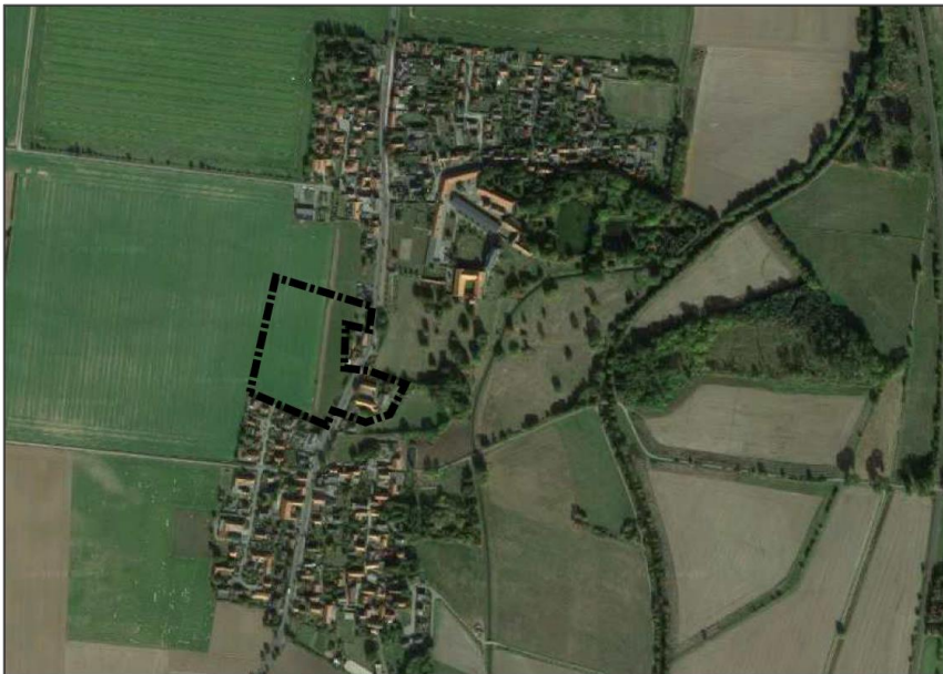
Abbildung des Geltungsbereiches, ohne Maßstab, © Google 2019

Im Auftrag von: Gemeinde Dorstadt Bahnhofstraße 6 38312 Börßum