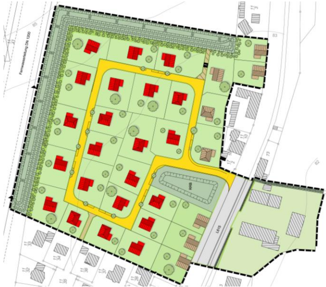
Städtebaulicher Entwurf, eigene Darstellung, genordet